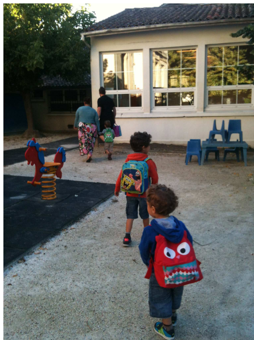
La rentrée côté maternelle