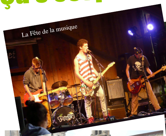
La Fête de la musique