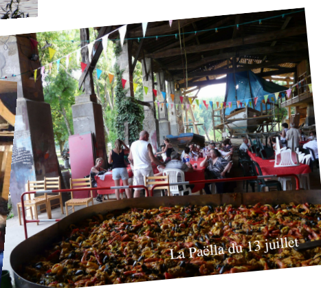
La Paëlla du 13 juillet