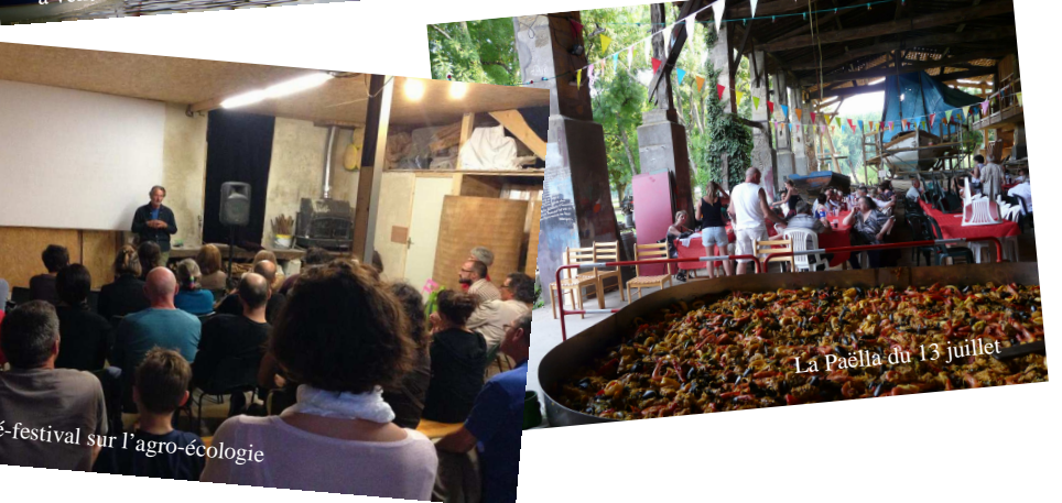
Le ciné-festival sur l'agro-écologie