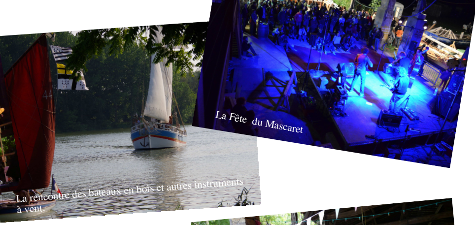
La Fête du Mascaret