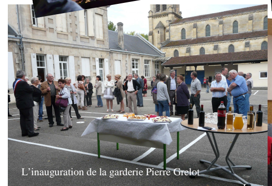
L'inauguration de la garderie Pierre Grelot