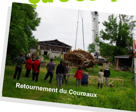
Retournement du Coureaux