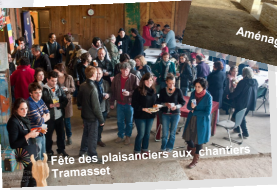
Fête des plaisanciers aux chantiers Tramasset