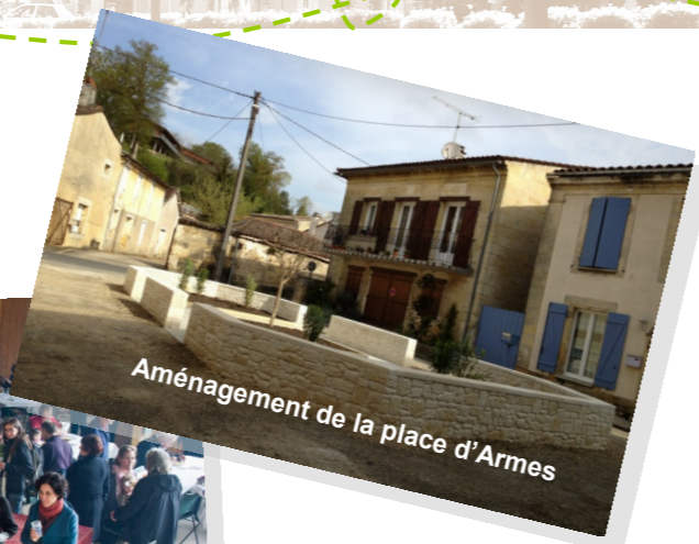
Aménagement de la place d'Armes